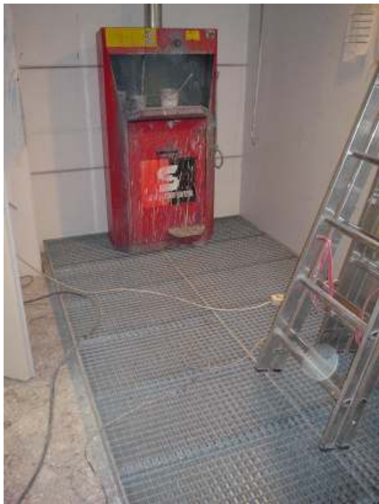
Hinweis: Praxisfoto während des Umbaus